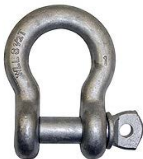
Grillete Alloy G209A 3/4" Perno Roscado