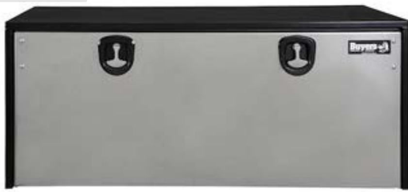
Caja de Herramienta mca. Buyers c/puerta Acero inoxidable (no incluye escuadras)