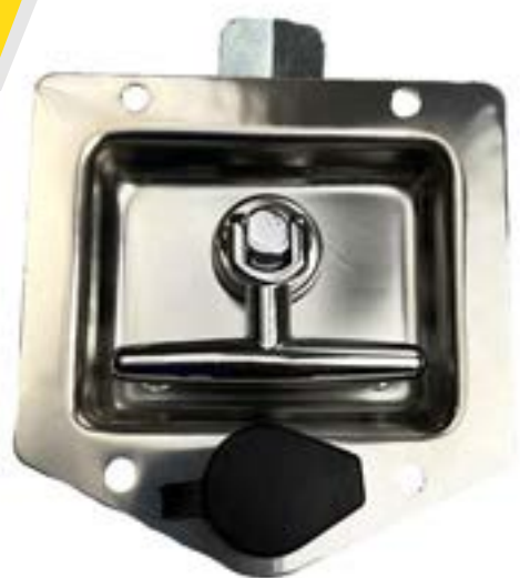
Chapa tipo "T" mca. AMK (Acero Inoxidable)