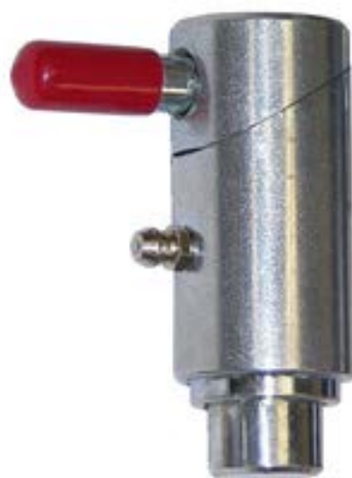
Plunger 1" mca. B/A