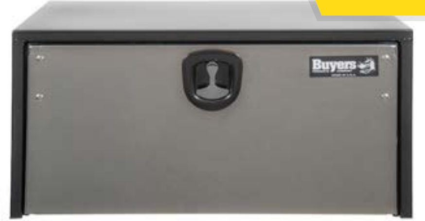
Caja de Herramienta mca. Buyers c/puerta Acero inoxidable (no incluye escuadras)