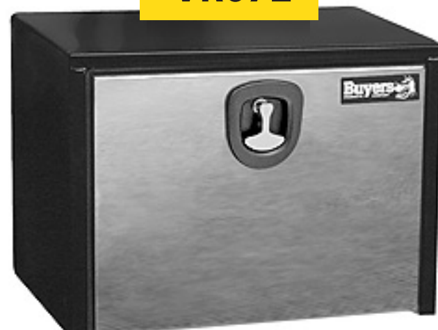
Caja de Herramienta mca. Buyers c/puerta Acero inoxidable (no incluye escuadras)