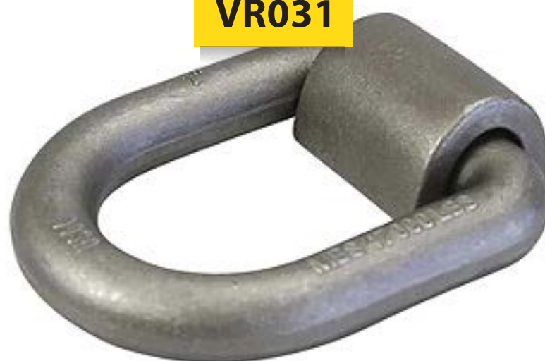
D-Ring Soldable 1" mca. AMK