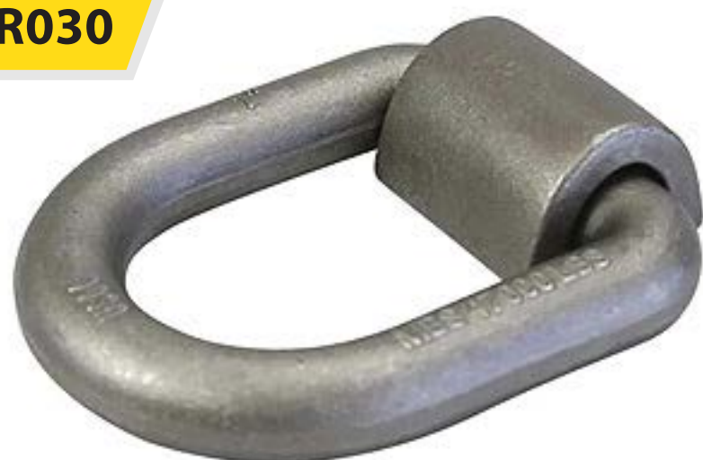
D-Ring Soldable 3/4" mca. AMK

Medida: 3/4" Capacidad máxima: 26,500 lbs