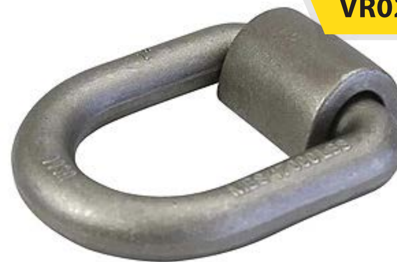
D-Ring Soldable 5/8" mca. AMK

Medidas: 5/8" Capacidad máxima: 18,000 lbs