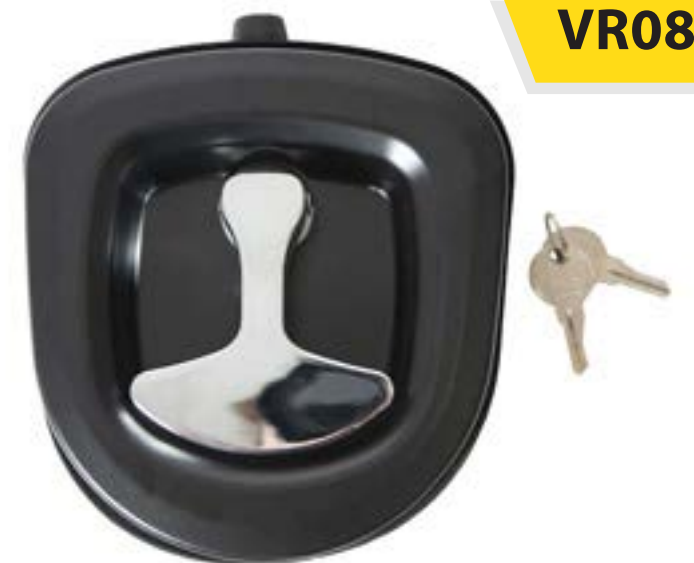
Chapa tipo Cola de Ballena mca. Buyers