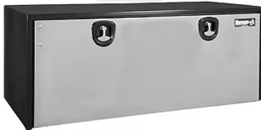
Caja de Herramienta mca. Buyers c/puerta Acero inoxidable (no incluye escuadras)