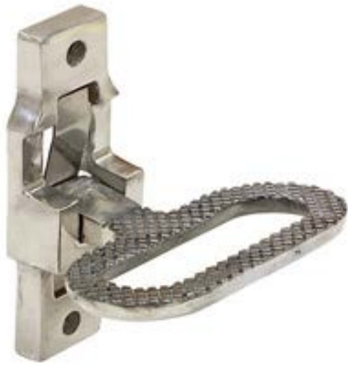
Folding Step mca. Buyers