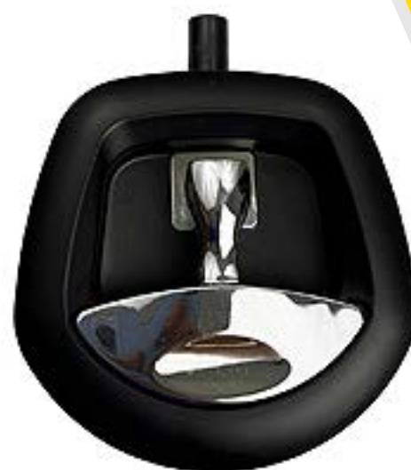
Chapa tipo Cola de Ballena mca. AMK