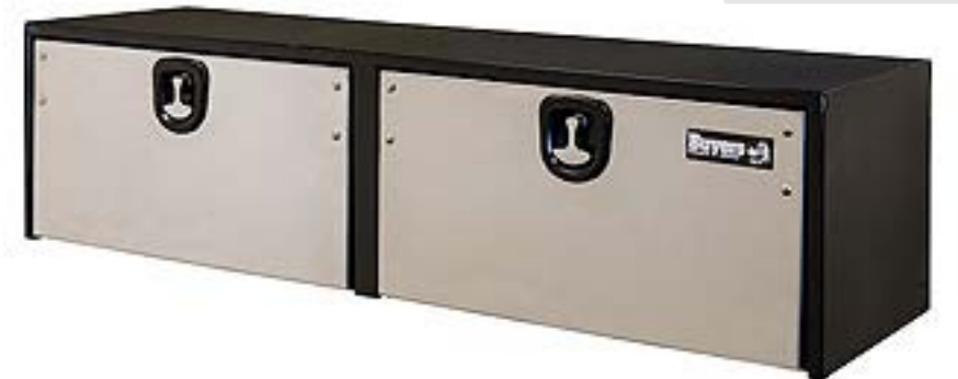
Caja de Herramienta mca. Buyers c/2 puertas Acero inoxidable (no incluye escuadras)