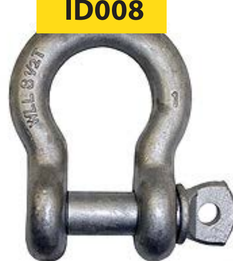
Grillete Alloy G209A 7/8" Perno Roscado

Medidas: 7/8" Capacidad máxima: 9.5 Tons.