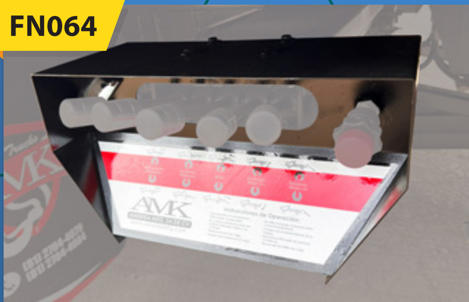
Caja de control AMK c/instrucciones