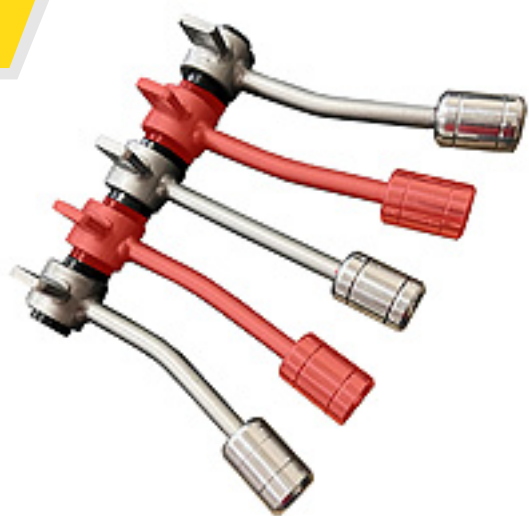
Palanca Intermedia AMK