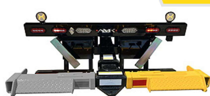
Funda Lado Derecho para Wheel Lift 4,000 lbs

Capacidad: 4,000 lbs (para uso en Tee de ptr 3.5" x 3.5")