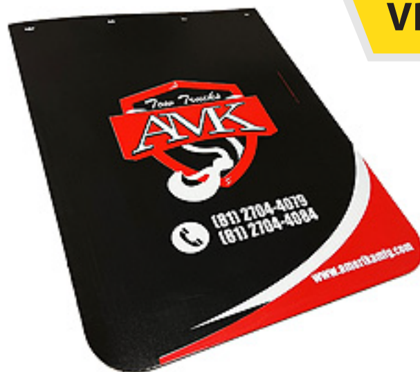
Lodera Antibrisa AMK - Grande

Medidas: 76 x 60cms Durable y resistente. Por pieza