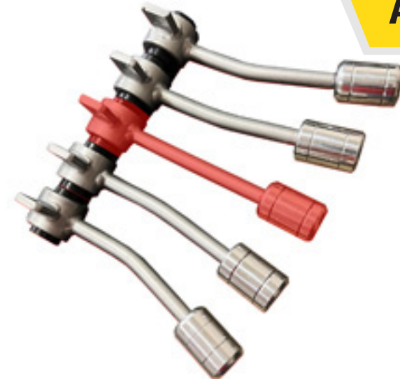
Palanca Central AMK