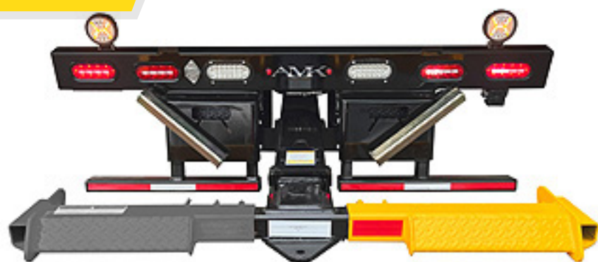
Funda Lado Derecho para Wheel Lift 3,000 lbs

Capacidad: 3,000 lbs (para uso en Tee de ptr 3" x 3")