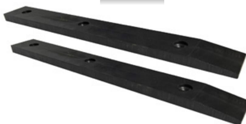
Par de Tablilla de nylamid 3/4" para grapa AMK