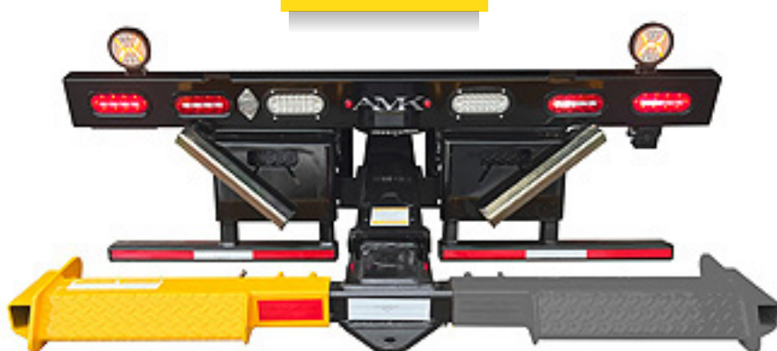
Funda Lado Izquierdo para Wheel Lift 3,000 lbs

Capacidad: 3,000 lbs (para uso en Tee de ptr 3" x 3")