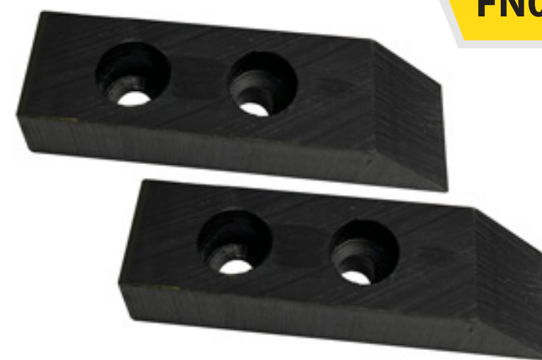
Par de Tacones de nylamid 1" para grapa AMK