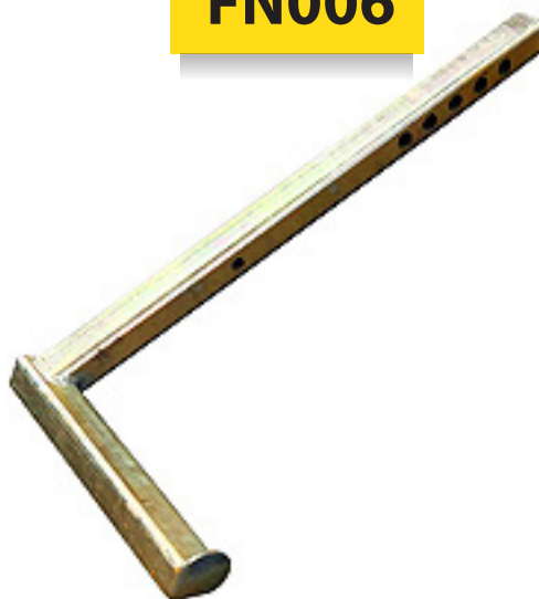
L-Arm 3,000 lbs