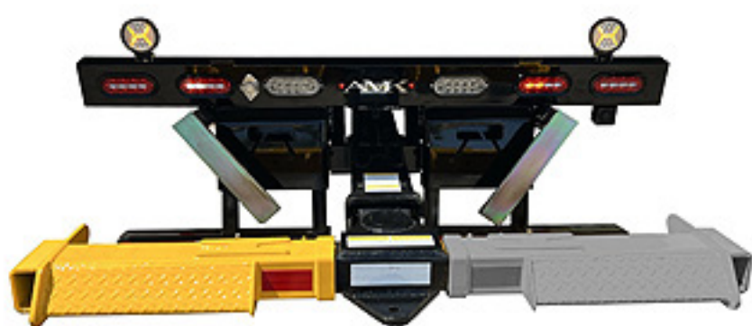
Funda Lado Izquierdo para Wheel Lift 4,000 lbs

Capacidad: 4,000 lbs (para uso en Tee de ptr 3.5" x 3.5")