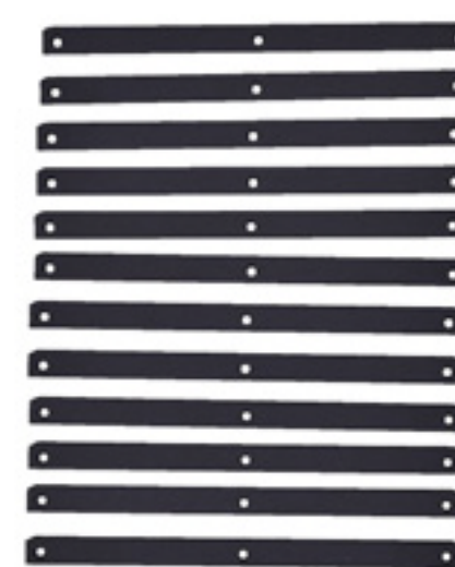
Juego de 12 Tablillas de nylamid 3/8" para marco AMK