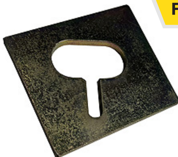
Keyslot cuadrado galvanizado