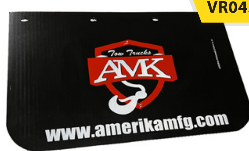
Lodera Antibrisa AMK - Mediana

Medidas: 38 x 60cms Durable y resistente. Por pieza