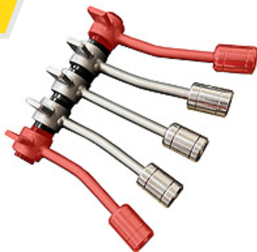
Palanca Lateral AMK