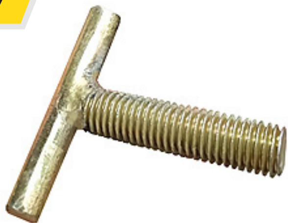
Mariposa 5/8" para asegurar fundas ó bases de horquillas