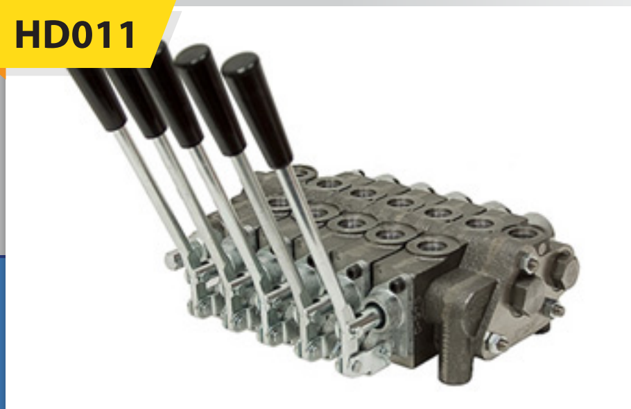
Block de Válvulas Mod. SV

Disponible de 1 a 10 secciones 12 gpm, Máx 3000 psi