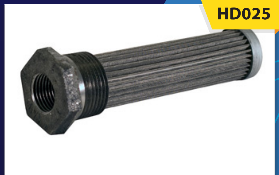
Filtro de Succión 2" NPT X 1-1/4" NPT

Filtros equipados con centro de malla de alambre de acero que permiten un mayor valor de filtración.