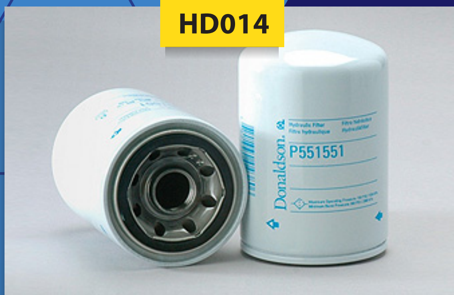
Filtro Hidráulico de retorno mca. Donaldson

Diseñado para eliminar contaminantes transportados por el aceite lubricante.