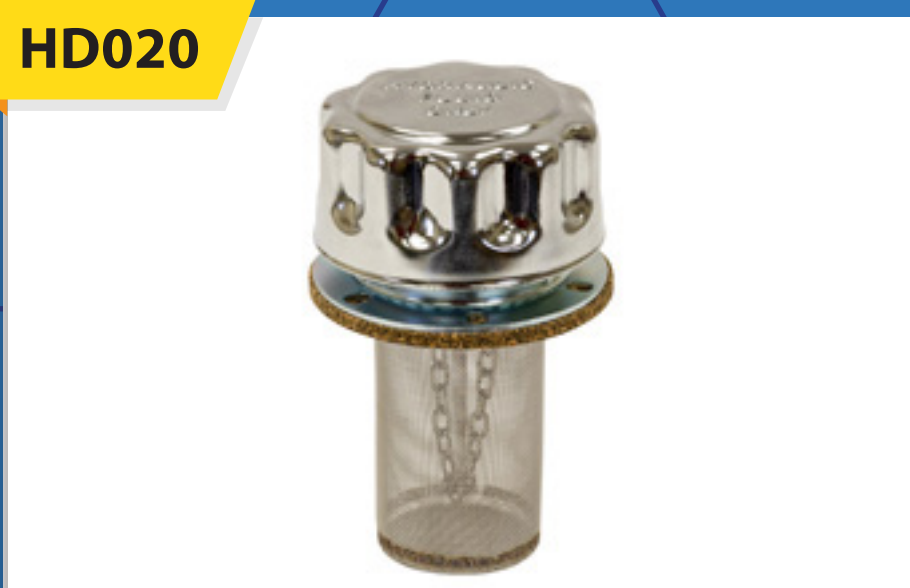
Tapón de Llenado para tanque hidráulico mca. Buyers

Se puede utilizar para llenar depósitos hidráulicos y también funciona como respirador.