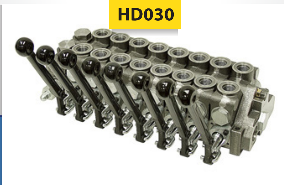
Block de Válvulas Mod. V20

Disponible de 1 a 10 secciones 20 gpm, Máx 3500 psi