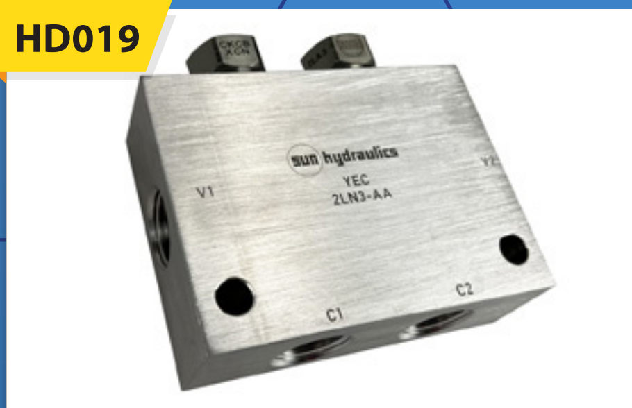
Válvula Doble Check mca. Sun Hydraulics