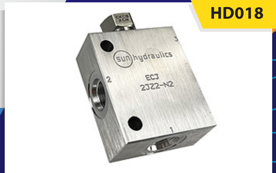
Válvula Check Sencilla mca. Sun Hydraulics