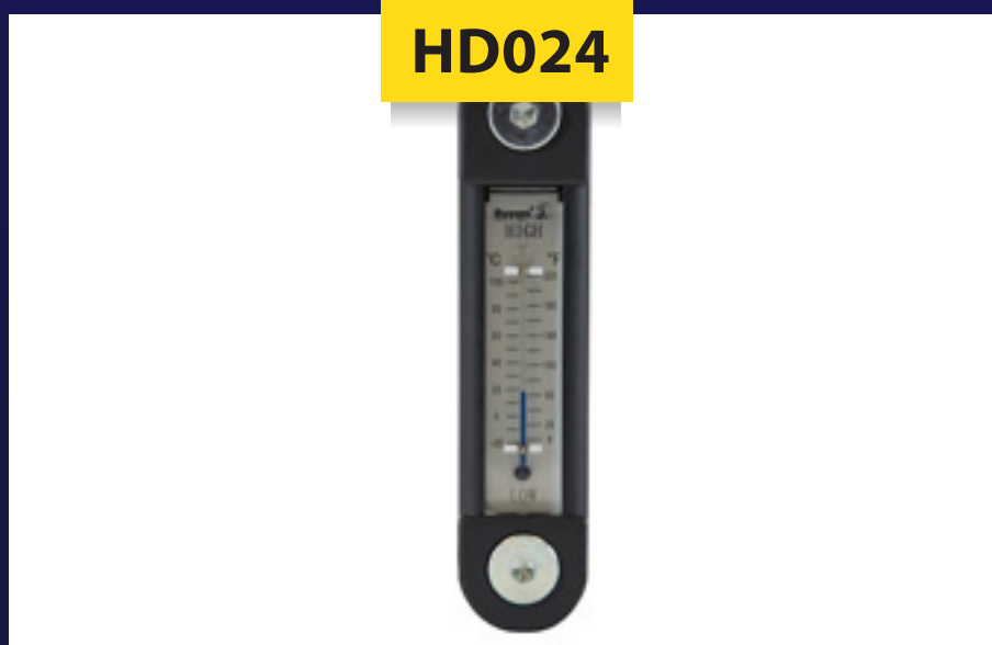
Nivel Termómetro con Base de Nylon mca. Buyers

Cuerpo de policarbonato y marco exterior de nailon resistente a las manchas y la corrosión.